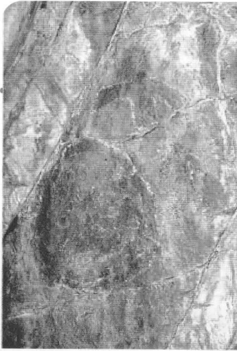
Писаница Хотогой-Хабсагай. Хоринский район. Бронзовый век. Фото: С.М. Конечных (Памятники археологии – Улан-Удэ, 2011 – Свод объектов археологического наследия Республики Бурятия. Т. 2).

ни выполнены краской и граффити. Выделяются изображения воинов-всадников на лошадях, верблюдов, солярные знаки и др. Петроглифы в технике граффити отличаются изображениями лошадей, везущих повозку, верблюдов, всадников, оленей, человечков и др. Также имеются изображения буддийского храма, фигура божества – бодхисатвы. Выбитое изображение животного из Бага-Зари было отнесено к древнетюркской эпохе.