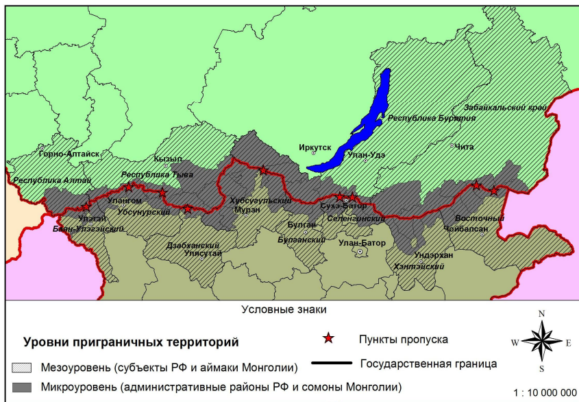
Рис. 2. Приграничные территории России и Монголии

Положительные трансграничные градиенты формируют предпосылки для сотрудничества стран, в частности, для приграничного сотрудничества, изменяя соотношение барьерной и контактной функций границы в пользу последней. Резкая неравномерность в обеспеченности ресурсами (сырьевыми, топливными, трудовыми, финансовыми, инфраструктурными и др.) создает основу для обмена через использование конкурентных преимуществ тех или иных территорий по обе стороны границы. Методологические основы исследования такого сотрудничества должны базироваться на своевременном обнаружении таких градиентов.