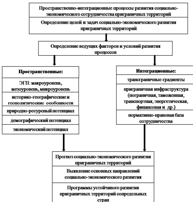
Рис. 1. Структурно-логическая схема исследования пространственно-интеграционных процессов социально-экономического сотрудничества приграничных территорий

ниц которых совпадают с государственной границей, мезоуровне – приграничные регионы; макроуровне – совокупность приграничных регионов (рис. 2).